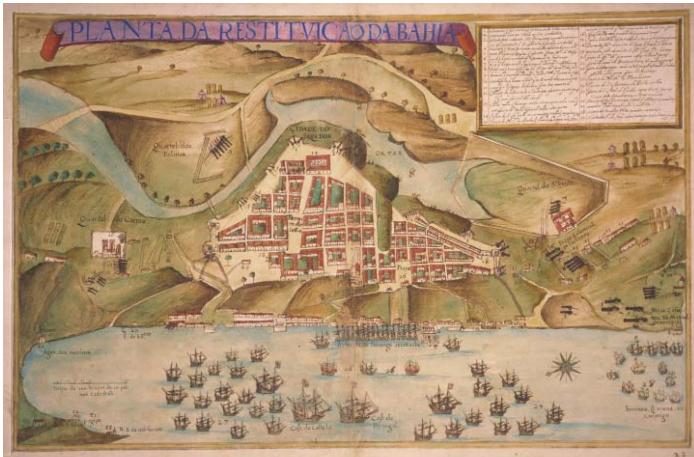
ALBERNAZ, J. T. Detalhe da Planta da Restituição da Bahia, 1631. Estado do Brasil Coligido das mais sertas notícias q pode aivntar, Dõ Jerônimo de Ataíde. Cosmographo de Sva Magde. Anno: 1631. Rio de Janeiro: Nova Fronteira/Banco BBM, 1997 (adaptado).

Na Bahia, o maior centro urbano da colônia, um viajante do princípio do século XVIII notava que as casas se achavam dispostas segundo o capricho dos moradores. A cidade que os portugueses construíram na América não é produto mental, não chega a contradizer o quadro da natureza, e sua silhueta se enlaça na linha da paisagem. Nenhum rigor, nenhum método, nenhuma previdência, sempre esse significativo abandono que exprime a palavra “desleixo” — palavra que o escritor Aubrey Bell considerou tão tipicamente portuguesa como “saudade” e que, no seu entender, implica menos falta de energia do que uma íntima convicção de que “não vale a pena...”