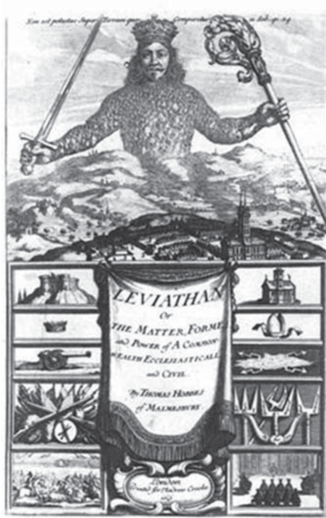
BOSSE, A. Leviatã , em 1651.

Tomando a imagem acima como referência, avalie as asserções a seguir e a relação proposta entre elas.